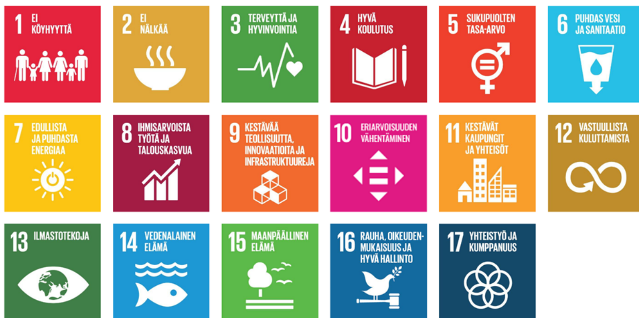
Kuva 1. YK:n kestävän kehityksen tavoitteet

järjestelmässä on seurattu hanketoiminnan vastaamista YK:n kestävän kehityksen tavoitteisiin. Jokaisen hankkeen kohdalla on ollut mahdollisuus valita järjestelmässä se, mihin YK:n kestävän kehityksen tavoitteisiin kyseinen hanke vastaa. YK:n tavoitteita on yhteensä 17 ja ne löytyvät kuvasta 1.